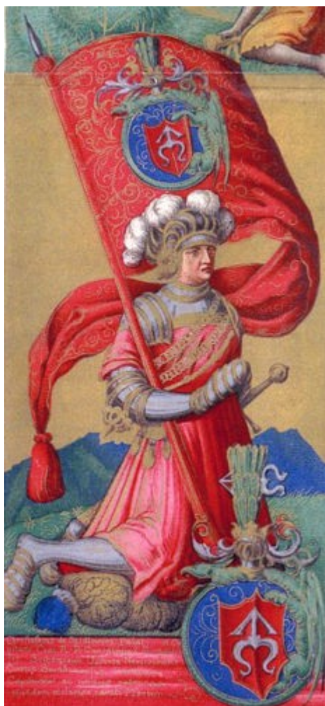
Krzysztof Szydłowiecki - odbitka chromolitograficzna wykonana przez Wojciecha Gersona na podstawie przywileju opatowskiego S. Samostrzelnika

działanie 3 – Opracowanie modelu wykorzystania zadań opieki nad zabytkami dla generowania nowych miejsc pracy.