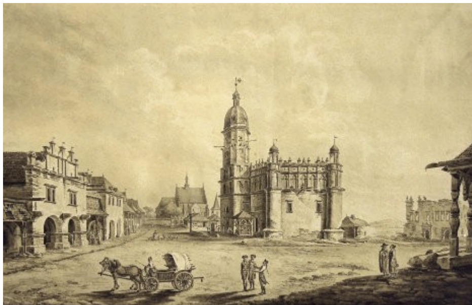
Zygmunt Vogel, Rynek w Szydłowcu, 1795

działanie 4 – wykorzystanie tożsamości kulturowej, jako elementu marketingowego (zdefiniowanie czterech najważniejszych obiektów i miejsc – ratusza, fary, zamku, góry Trzech Krzyży jako rozpoznawalnych elementów obrazu miasta, wykorzystywanie ikonografii z czasów świetności miasta)