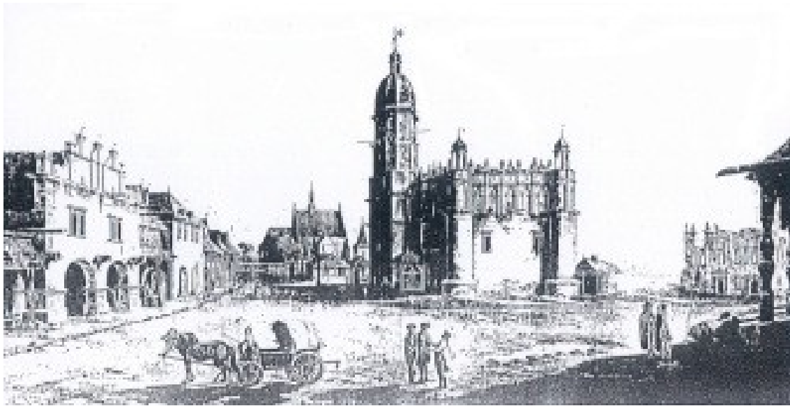
Ratusz, Fara i Rynek w Szidłowcu, rycina Zygmunta Vogla z XVIII